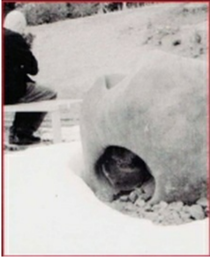
Ilustración de la cubierta: fotografía de Ximena Berecochea especialmente realizada para la edición mexicana.